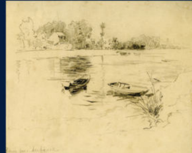
Robert Sterl, Paris bei Auteuil, 1893, Bleistift, ca. 185 x 224 mm, Robert-Sterl-Haus Naundorf, Z 1053

französischen Impressionismus gilt sein besonderes Interesse dem Treiben des Großstadtmenschen. Alltagsszenen wie Gespräche auf der Straße oder ein Besuch im Café finden Ergänzung durch Darstellungen feierlicher Zusammenkünfte größerer Menschenmengen wie Beerdigungen oder Prozessionen.