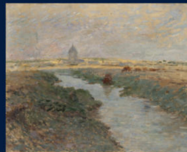
Robert Sterl, Flusslandschaft in Frankreich bei Abend, 1893, Öl auf Leinwand, 41 x 50 cm, Robert-Sterl-Haus Naundorf, G 74, Foto: Jürgen Karpinski

Von großer Wissbegierde getrieben, bewirbt sich der junge Robert Sterl schließlich um einen Studienplatz an der renommierten, privaten Académie Julian. Nachdem seine Bemühungen nicht von Erfolg gekrönt sind, verlagert er seine Studien in das Pariser Umland.